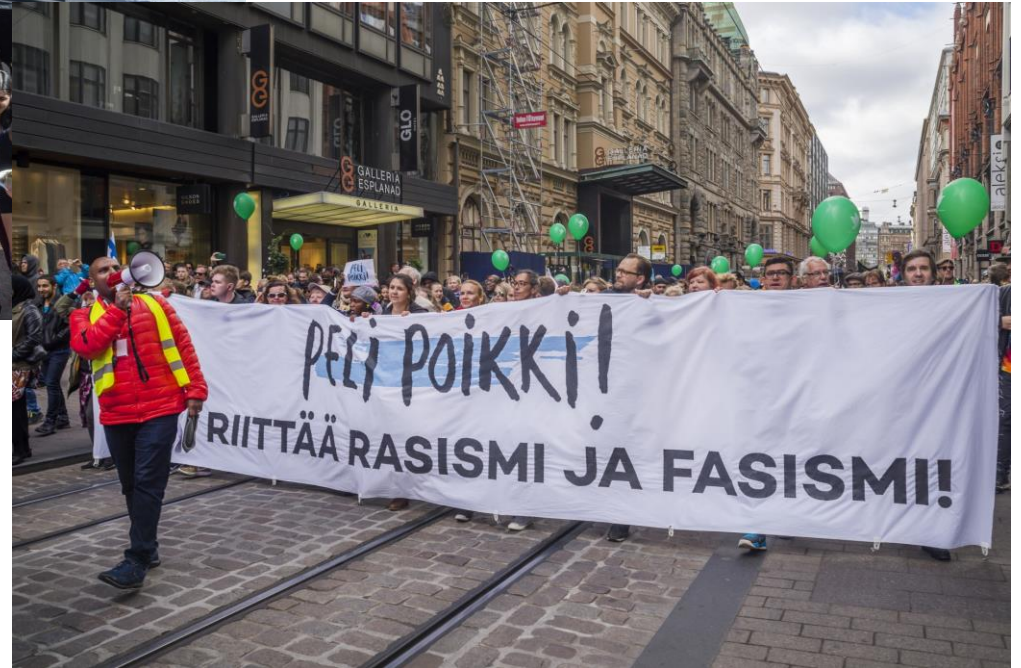
Peli poikki – mielenosoitus. HK8004:81