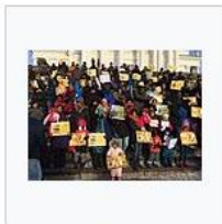
Finland Jallikattu Protest.jpg 3,264 × 2,448; 2.72 MB