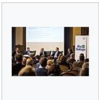
Äly On Tekoja -projektin ja pääministerin tekoalyseminaari Säätösalolla 7.2.2017 (1).jpg 1,577 × 996; 354 KB