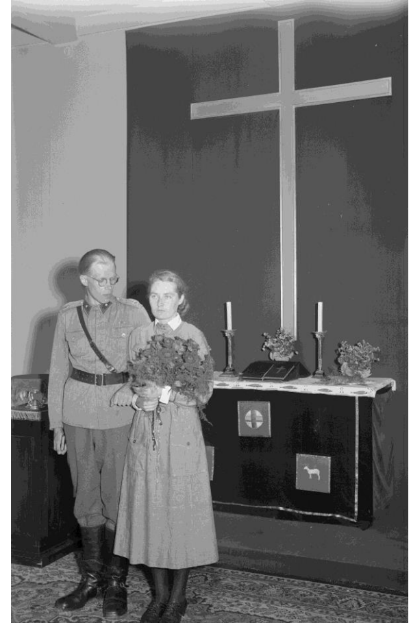
Hääpari 1942. HK19670603:46372