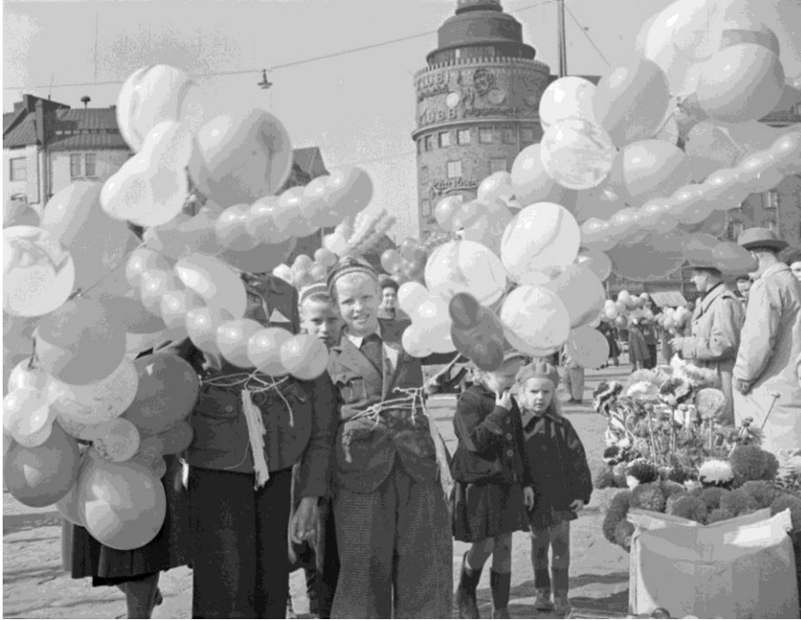
Vappu 1952 Helsingissä. HK7519:2.448