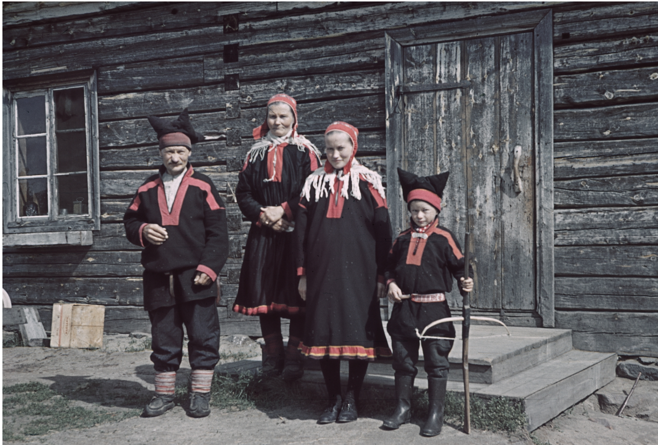
Saamelaisperhe 1940-luvulla. Kuva: Aarne Pietinen Oy, Museovirasto, HK6869:6.5