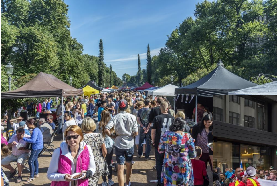
Ravintolapäivä. HK8004:48