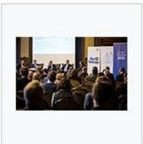
Äly On Tekoja -projektin ja pääministerin tekoalyseminaari Säätösalolla 7.2.2017.jpg 2,035 × 1,332; 504 KB